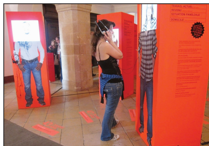
Trois bénéficiaires de l'aide sociale témoigneront sur des vidéos de leurs conditions de vie.